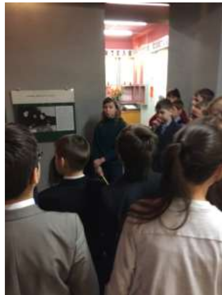
Станислава Гальцева. "Создание Волховского фронта. Кирилл Афанасьевич Мерцков"