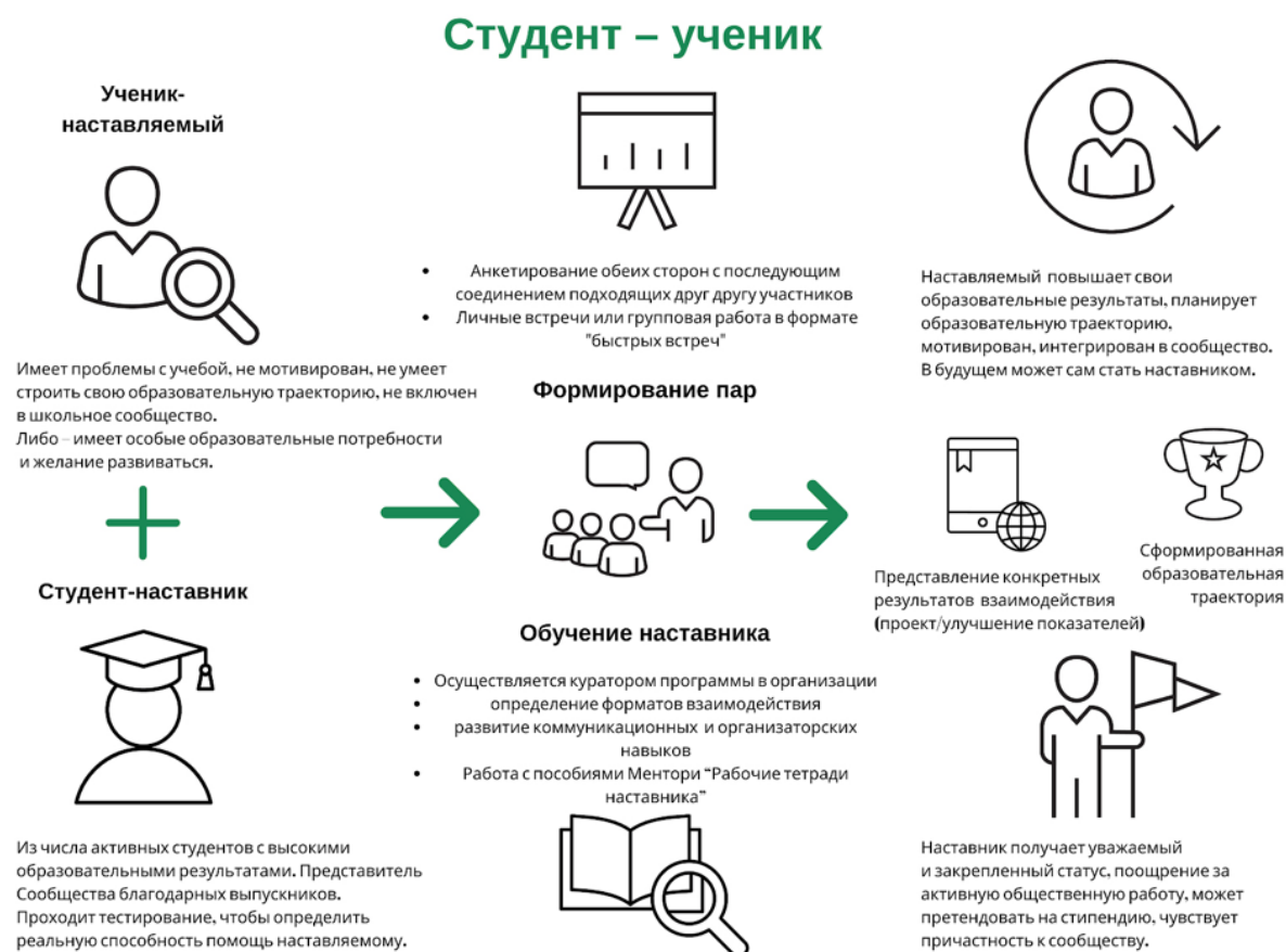
Рисунок 3. Графическое представление наставнического взаимодействия по форме «студент – ученик»