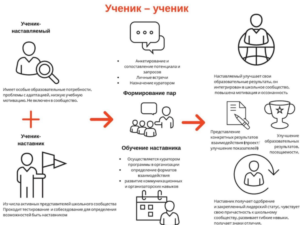
Рисунок 1. Графическое представление взаимодействия по форме «ученик – ученик»

незащищенностью и конфликтами внутри класса и школы.