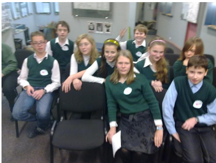
Ребятам были вручены грамоты и «сладкие» призы.