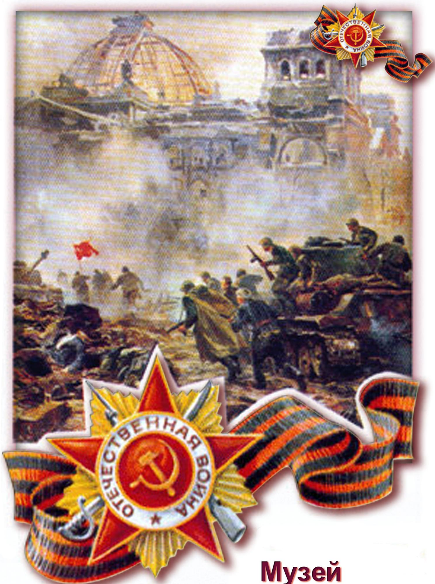
Музей “Из истории Волховского фронта”